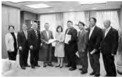
区長に予算要望する区議団